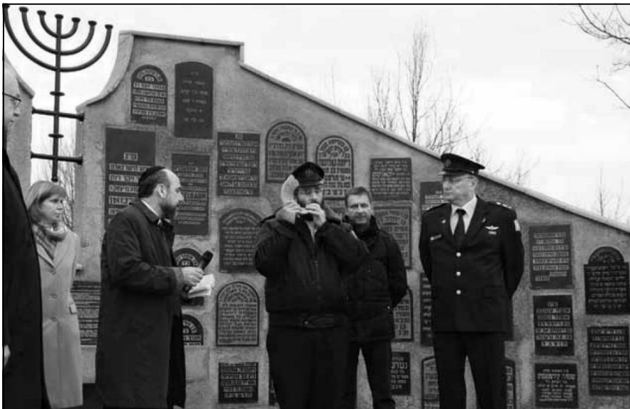
חונכת אנדרטה בראדום שהוקמה על ידי אסירים פולניים משברי מצבות